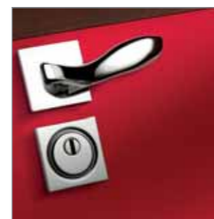
A Maniglia design by Fusital