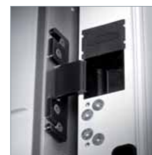
F Cerniere a scomparsa regolabili