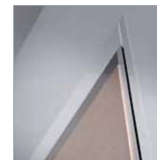
C Stipite "filo muro"