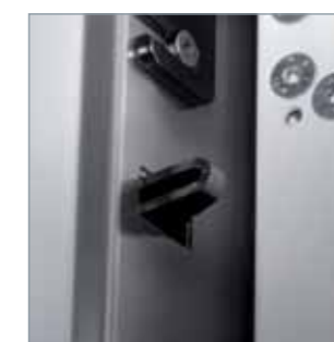
G Rostri fissi rinforzati