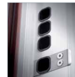
D Guarnizioni di battuta