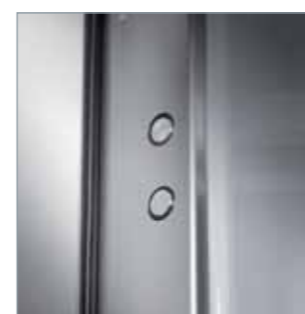
E Carena in acciaio inossidabile anti impronta