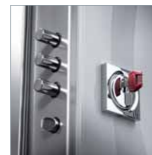
B Serratura a cilindro europeo con Defender di sicurezza